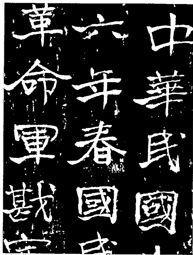
4-66 民國十九年秋先烈紀念碑記 圖14